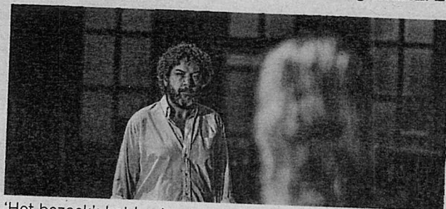
'Het bezoek': het beste stuk van De Roovers in jaren.

De opwinding over haar terugkomst maakt algauw plaats voor opschudding. Madame Claire is immers niet zomaar gekomen. Ze